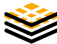
RENFORCEMENT & OPTIMISATION DES COUCHES DE FORME